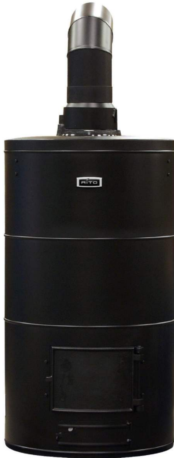
Банные печи Aito AK-78 / AK-95 / AK-110